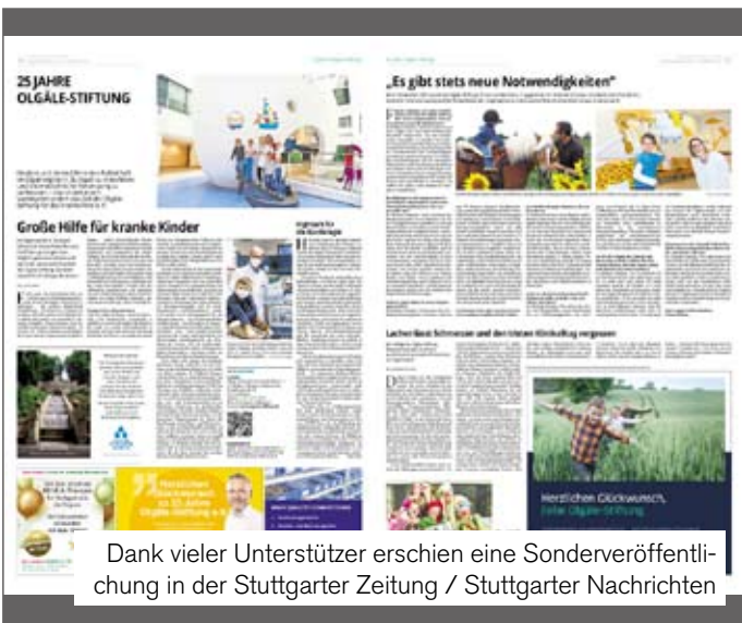
Dank vieler Unterstützer erschien eine Sonderveröffentlichung in der Stuttgarter Zeitung / Stuttgarter Nachrichten