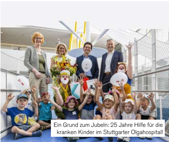
Ein Grund zum Jubeln: 25 Jahre Hilfe für die kranken Kinder im Stuttgarter Olgahospital!