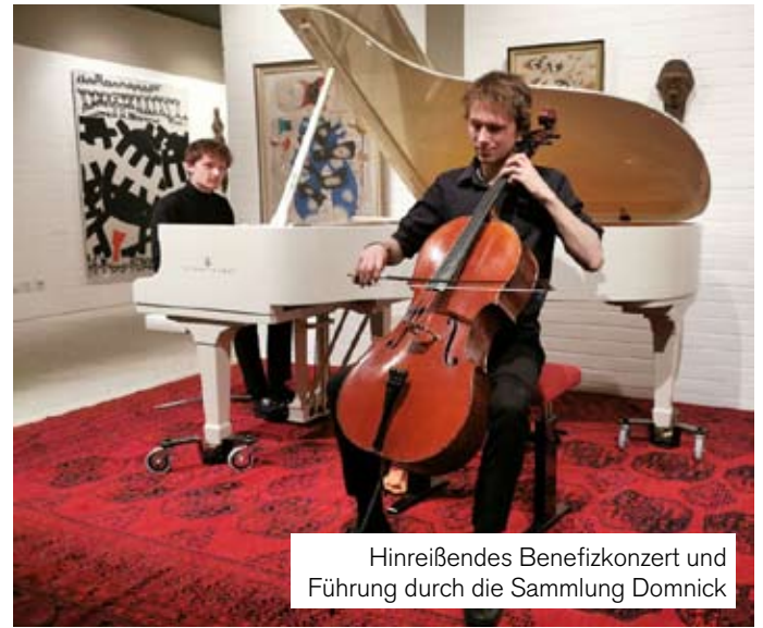
Hinreißendes Benefizkonzert und Führung durch die Sammlung Domnick