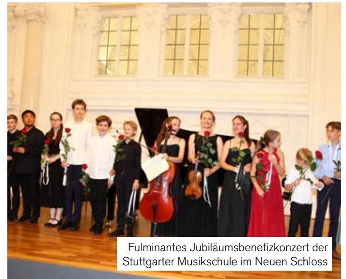
Fulminantes Jubiläumsbenefizkonzert der Stuttgarter Musikschule im Neuen Schloss