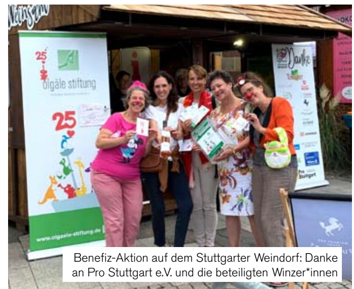
Benefiz-Aktion auf dem Stuttgarter Weindorf: Danke an Pro Stuttgart e.V. und die beteiligten Winzer*innen