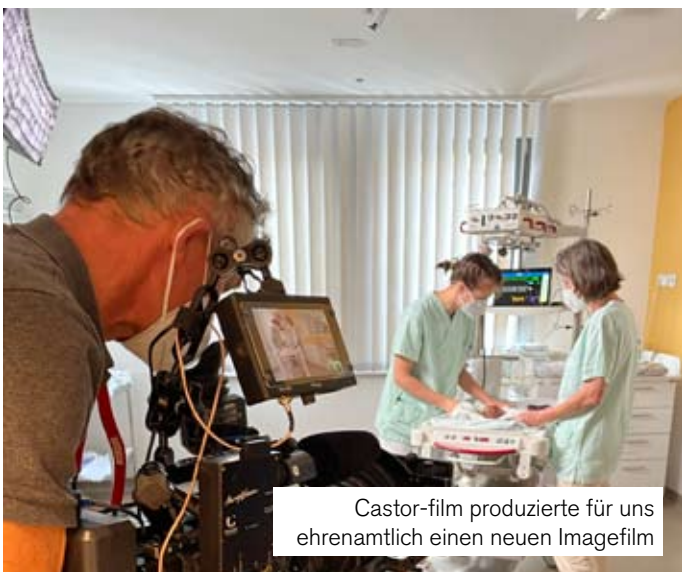
Castor-film produzierte für uns ehrenamtlich einen neuen Imagefilm