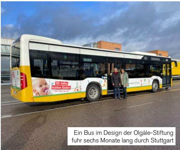
Ein Bus im Design der Olgäle-Stiftung fuhr sechs Monate lang durch Stuttgart