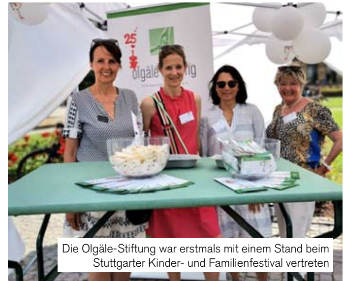
Die Olgäle-Stiftung war erstmals mit einem Stand beim Stuttgarter Kinder- und Familienfestival vertreten