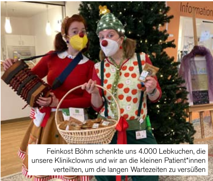
Feinkost Böhm schenkte uns 4.000 Lebkuchen, die unsere Klinikclowns und wir an die kleinen Patient*innen verteilen, um die langen Wartezeiten zu versüßen