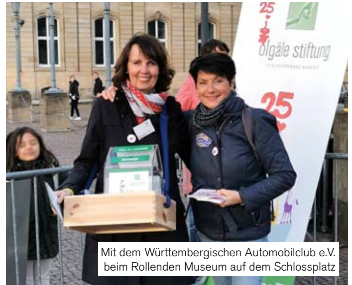
Mit dem Württembergischen Automobilclub e.V. beim Rollenden Museum auf dem Schlossplatz