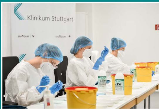
Aufbereitung des Impfstoffes