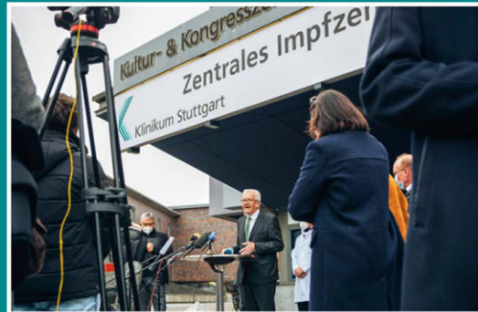
Eröffnung des Impfzentrums durch Ministerpräsident Winfried Kretschmann am 27. Dezember