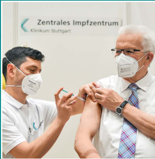
Impfung für Ministerpräsident Winfried Kretschmann