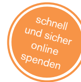
Illustration: Prof. Andreas Hylkaade Gestaltung: Status Kommunikation und Verlag

Spendenkonto: IBAN DE22 6005 0101 0002 2665 50 BIC SOLADEST600 · BW-Bank Stuttgart