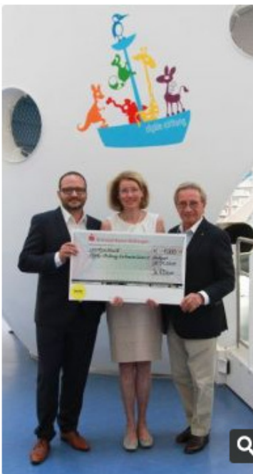
Spendenübergabe in der Olgaklinik